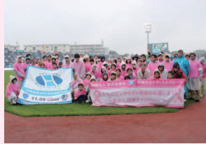
ピンクリボンマッチ (ピッチで 職員が乳がん検診啓発ウォーク)