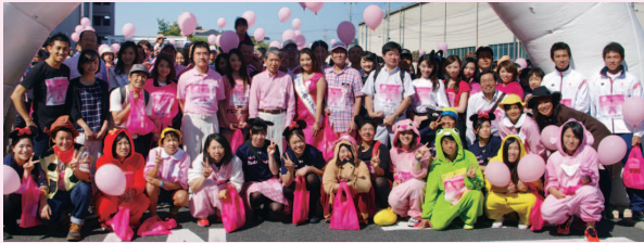
ピンクリボンウォーク | N戸田市