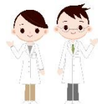
臨床検査科スタッフ