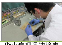
術中病理迅速検査