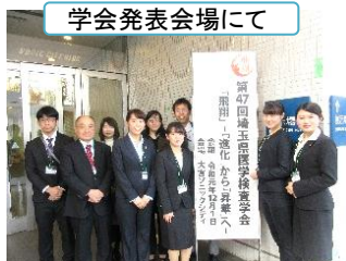
学会発表会場にて