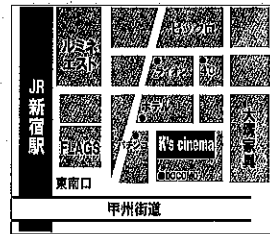
新宿 K's cinema