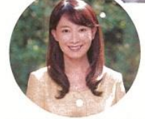
ライトアップ点灯式ゲストの アグネス・チャンさん

大宮ソニックシティビルに大きな ピンクのリボンが投影されます ☆ピンクリボンミニウォークINさいたま新都心10月21日午後4時～ ☆ピンクリボンミニウォークIN大宮10月21日午後4時～ ☆ピンクリボンミニウォークIN大宮10月21日午後4時～ ☆ピンクリボンミニウォークIN大宮10月21日午後4時～