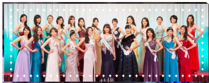
2017ミス・アース・ジャパン埼玉 ファイナリストのみなさん