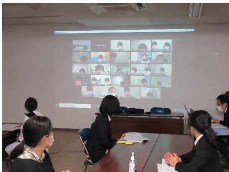
【集合・Webのハイブリッド開催】

12月14日(月)、各施設の入職1～3年目の実践能力向上を目的として、予期せぬ検査データが出た際の対応『検体検査編』をテーマに開催しました。研修会では検査前、中、後に分けて事例を提示し、各工程で起こりうる「原因」「対策」を各講師の経験を踏まえた内容で行いました。参加者からは、特に夜勤一人で不安なことも多いが、検査結果についてあらゆる可能性を考え報告することの重要性を再確認できたことや、他施設の意見や対策が共有できて役立つという感想が多く寄せられました。各施設においても情報共有して頂けるよう定期的な開催に努めてまいります。