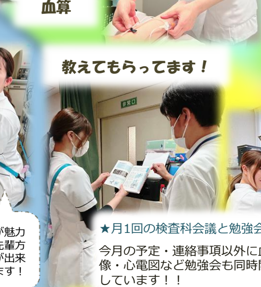
教えてもらってます！

当院は検体と生理検査の両方に携わるのが魅力です。その分覚えることが多いですが、先輩方の丁寧な指導のもと、安心して学ぶことが出来ています。一人立ちできるよう、頑張ります！