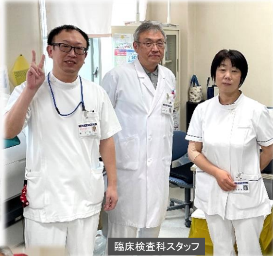
臨床検査科スタッフ