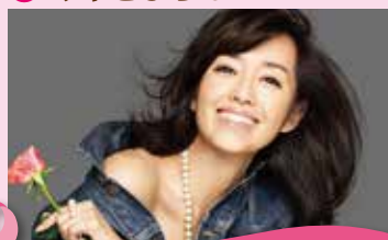
ピンクリボンショー ゲスト 早見優さん(歌手)